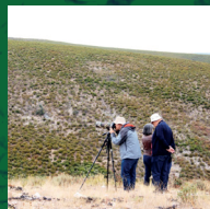
Observação de veados