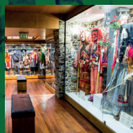
Museu Ibérico da Máscara e do Traje