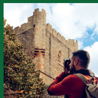
Visita guiada ao centro histórico de Bragança