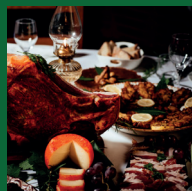
Gastronomia da rota da terra fria transmontana